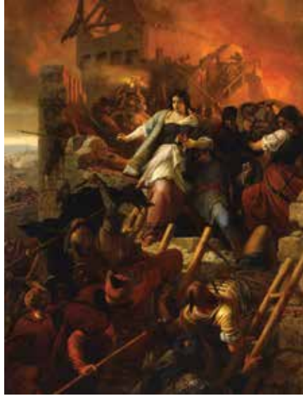
Székely Bertalan: Egri nők, 1867

A legújabb átfogó terv a globális felmelegedés megállítására Paul Hawken nevéhez fűződik. A szerző már több nagy hatású könyvet adott közre, melyek közül kiemelkedik a The Ecology of Commerce [1993] és a Natural Capitalism [1999]. Hawken ezúttal egy nagy projektet szervezett: Drawdown , melyben százánál több tudós működik közre. A szó magyarra körülbelül szint-süllyedésnek vagy depresszió fordítható, de