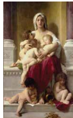
Bouguereau: Charity, 1878

A tanulmány a Nemzeti Kutatási, Fejlesztési és Innovációs Hivatal támogatásával az NKFI Alapból valósult meg [K 120044].