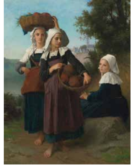
Bouguereau: Piacról hazatérő lányok, 1869

telt nők száma messze meghaladja a férfiakét, még a hagyományait kényesen őrző római katolikusoknál is. Sokatmondó statisztika lenne megnézni, a szentek között mennyi a férfi és a nő. Érdekes Jézus példája is: végig voltak – habár nem „hivatalos” apostoli minőségben – élvonalbeli női követői, keresztje alatt ott áll például leghívebb tanítványa, Mária Magdolna. A hívők pedig Szűz Máriát tisztelik elsőként a szentek, s az emberek között.