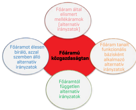
3. ábra: Az alternatív közgazdasági irányzatok csoportjai

öncékként jelenik meg. A jelenségről már az 1960-as években publikált Capra [1966], majd közel 30 évvel később Schumacher [1991] is foglalkozott a témával, később pedig többek között Korten [1996] és Papp [1997] is. A főáramú közgazdaságtant egyre több kritika érte az 1960-70-es évektől, ami kedvezett az alternatív közgazdasági irányzatok létrejöttének. A 2007-2009-es gazdasági világválság hatására az egyes alternatív irányzatok mindinkább