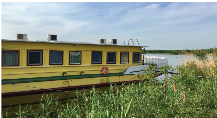
Egy valódi tavi öko-szálláshely: az abádszalóki Tündérfátyol Szállodahajó

A Tisza-tó szolgáltatásainak kialakítása a 2000-es évek második felében vált intenzívvé. A régió 1998-ban lett kiemelt üdülőkörzet, megalakult a túráközpont-hálózat, és aktív TDM-együttműködés kezdődött. 2010-ben megérkezett az első nagy nemzetközi siker, mivel a tó elnyerte az Európai Bizottság „Kiváló Európai Desztinációk” díját [Turizmus Online, 2010]. 2012-ben megnyílt a poroszlói Ökocentrum, mely már a megnyitás évében 155 ezer látogatót fogadott, ez a szám 2018-ban meghaladta a 220 ezret [heol.hu, 2018]. Ahogy az egész Tisza-tó, úgy az Ökocentrum is egy komplex szolgáltatásokat kínáló, számos érdeklődést kielégítő létesítmény. Központi eleme a 735 ezer literes édesvíz akvárium, a kiállítás emellett számos hullót és kétlélőt mutat be, valamint hangsúlyosan tartalmazza a Tisza-tó élővilágának részleteit. Az Ökocentrum egyik fő célkitűzése a gyakorlati oktatás megvalósítása, melyhez előadóterem és egy nemrég korszerűsített háromdimenziós vetítőterem is kapcsolódik. Az Ökocentrum